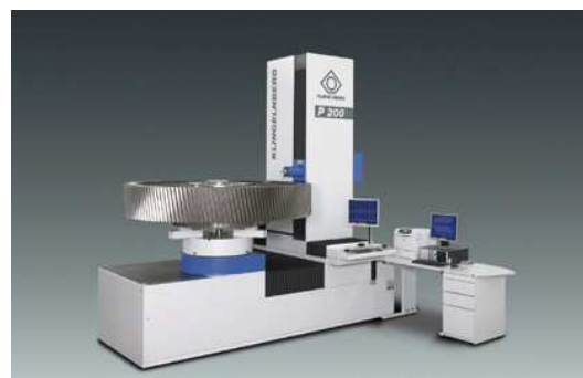
Verzahnung messen: Klingelberg P 200