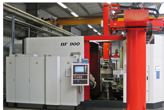
Verzahnung Wälzfräsen: Höfler HF 900