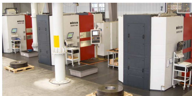
Profilschleifen: Höfler Rapid 900

Genügend Kapazitäten schaffen uns Spielraum, jeweils den effizientesten Fertigungsablauf zu nutzen. In gewohnter Stelter-Qualität, versteht sich - SPC natürlich inklusive. Alle Prozessparameter werden elektronisch dokumentiert und können Ihnen zur Verfügung gestellt werden.